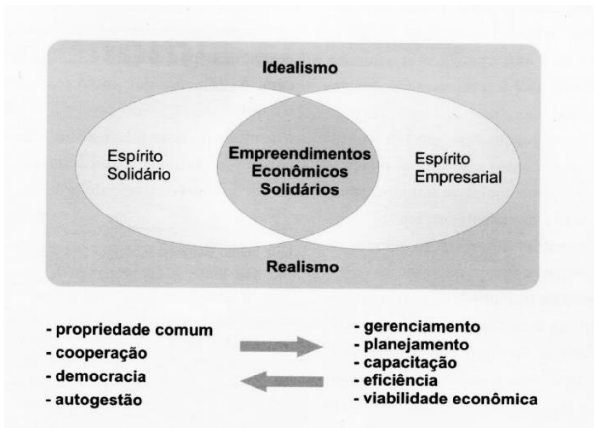
Figura 2. O socialismo empreendedor. Sindicalismo e Economia Solidária: reflexões sobre o projeto da CUT . Central Única dos Trabalhadores, 1999.

cívica” que despertaria o interesse sobre o cenário da política nacional. Essa nova consciência se realizaria nos próprios ambientes de trabalho que, através do exercício da democracia forçado pela convivência o desejo de participação seria inflamado. Nas cooperativas todos são autônomos e donos do empreendimento, portanto, seria necessário que os sujeitos envolvidos conversassem entre si para chegarem a um acordo democrático sobre as decisões a serem tomadas. Além disso, dentre as benesses, teriam a capacidade de resistir aos momentos de crise econômica justamente por não responderem moralmente, por assim dizer, de forma que divida e agudize ainda mais a crise. No projeto Sindicalismo e Economia Solidária: Reflexões sobre o projeto da CUT , apresentava uma imagem ao público simbólica do teor do discurso sobre economia solidária: